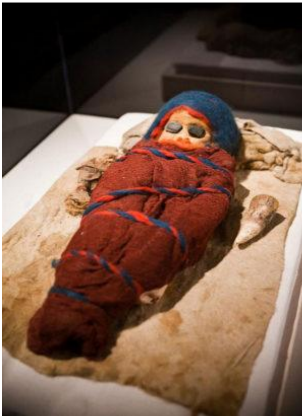
Baby met vilten mutsje